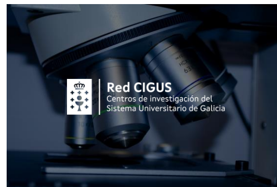
► Ejemplo fondo de color

El brillo del fondo debe garantizar un contraste adecuado que asegure la perfecta legibilidad del logo en su versión de color.