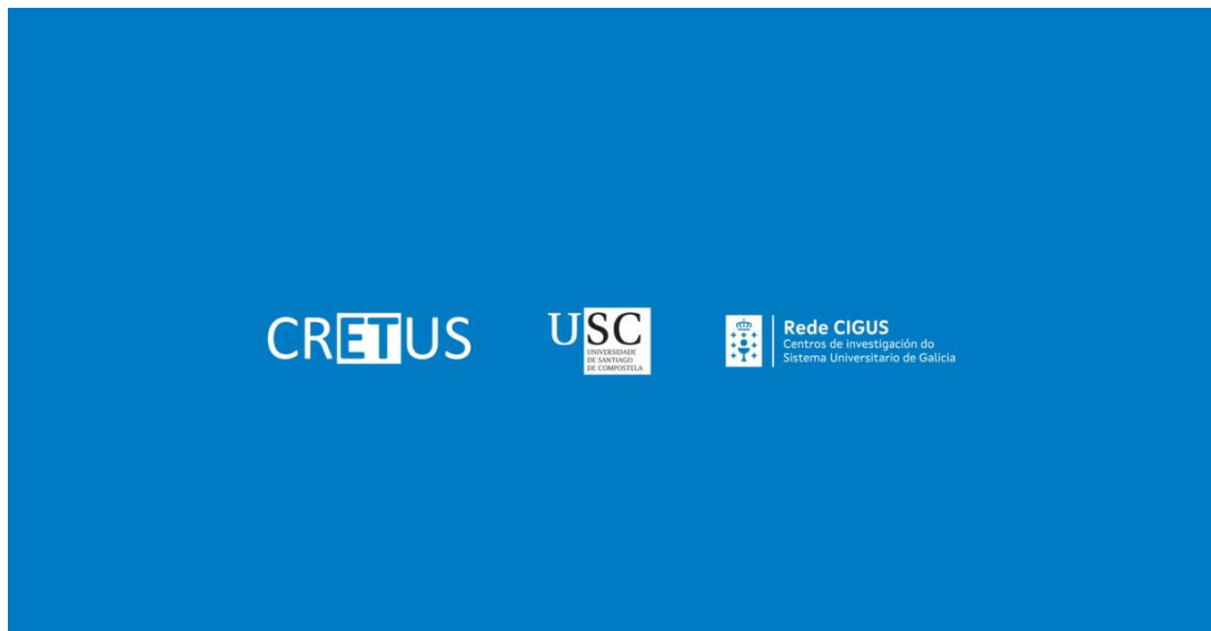
► Ejemplo de sobreimpresión previa al cierre.